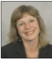
Jane Davidson (Gweinidog yn y Cynulliad) Llafur