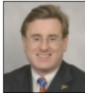
Peter Black Cadeirydd Democratiaid Rhyddfrydol Cymru