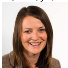
Bethan Jenkins AC Plaid Cymru Gorllewin De Cymru