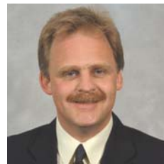
Mark Isherwood AC Plaid Geidwadol Cymru Gogledd Cymru