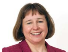
Lynne Neagle AC Llafur Torfaen