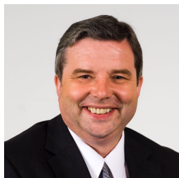
Dai Lloyd Plaid Cymru Gorllewin De Cymru