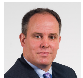
Andrew R T Davies Plaid Geidwadol Cymru Canol De Cymru