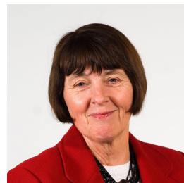
Val Lloyd Llafur Dwyrain Abertawe