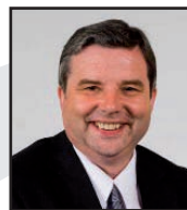
Dai Lloyd Gorllewin De Cymru